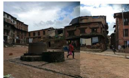
2000年、Nepal Baktapur 市Lesing Khal (銚車の通る道という意味)の広場。ここは都市農村混合広場で、最も美しくあったが、2015年5月の大地震で今は正面の建物完全崩壊、左側は半壊、この地区の再生を応援したい。