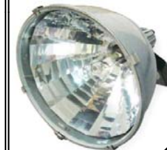
ペンダント(高天井用照明器具) ※写真左 設置例:工場内天井 ※写真右