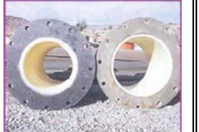
Rhino eXtreme(※3) (ライノ・エクストリーム) 対象:床等