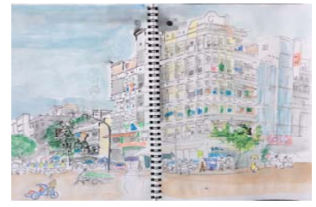
カンボジアのプノンペンにて書いたスケッチ

しかし偉そうなことを言いながら、日本人のひとり旅と見ればそれはかまが歩いているということだと、スリや、幼い乞食少女までそう考えるのでしょうか。それはわかっていながら、それでもスリに昨夜は150ドルを取られたり、滞在ビザで3ヶ月1万5000円を大阪の境の正直で確保したのですが、それは途中で出国すると無効になるということも知らずにいたこと。これは結果的に追加して1万円程、それも袖の下に50ドル程取られたりしています。カフェラテを頼んで、コールドミルクコーヒーが出てきたり、なかなか仏のような穏やかな顔つきで過ごせないのも事実です。ビザを申請するときには数度の出入国を可能とするビザを貰う必要がありますし、空港ではできるだけメーター型のタクシーを利用しなければなりませんし、お金はポケットに最小限の現金を入れ、取られても悔いのない仕掛けしておく防衛策が必要ですね。日本の社会は、ありがたいことに、袖の下も少なく、スリや横領も数少ない、ある意味で世界に誇る無菌国家なのかもしれません。アジアの経済発展と連携するということは、こういった弊害とも付き合っていくことも覚悟せねばならないのだと気を引き締めています。少々の被害も覚悟しながらアジアの未来ある混沌に身を任せてみるのも面白い人生が開けるのではないのでしょうか。