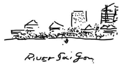
ゆったりと、サムサイゴンの、風そよぐ、流れのままに、我が身もまた はじめてのiPadの絵