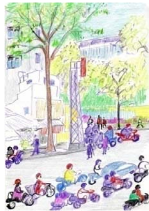
オートバイで街が占領されている。それでもきちっと歩道があるのはフランスの都市計画だからだ。