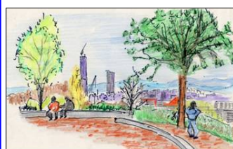
大阪近鉄阿倍野の超高層アスカル300メートルを大正区の昭和山頂上33メートルから見る。