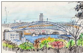
大正区の津波対策防災拠点昭和山33メートルから大阪南港のアジアトレードセンター(TWA)を見る。