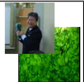
ブルーグリーンアルジー(AFA)

藍藻類は35億年前に誕生し、想像もつかないほど過酷な環境下で酸素を作り、動物・植物が生存できる環境を創造してきました。その環境下で、自ら作った酸素の害から身を守るための物質を体内で作り続けている生物です。と同時に、現在とは比べ物にならないくらい強烈な紫外線から身を守るための成分も体内で作り続けている生物でもあります。